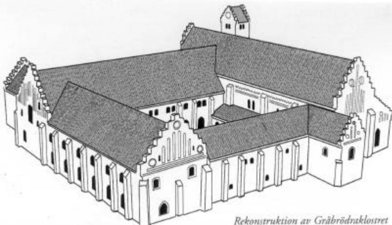
Rekonstruktion av Gråbrødraklostret vid 1500-talets början.

Nærmere oplysninger senere. Men reserver datoen.