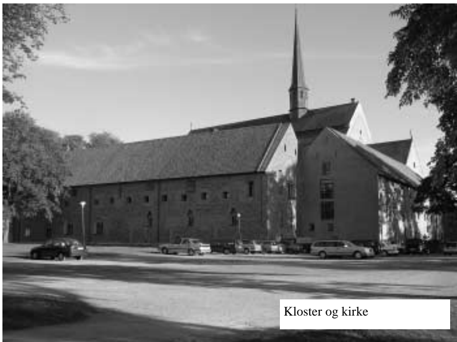
Kloster og kirke

te klemmer i Guds frie natur. Der blev også undervejs tid til at bese nogle ruiner af et gammel kloster, Alvastra, som lå ved sydspidsen af Vättern. Vi var begunstiget med dejlig vejr og nød turen i fulde drag, også fordi vor svenske chauffør var en rigtig guttermand, som kørte bussen stille og roligt og underholdt os med små oplysende bemærkninger om hist og pist.