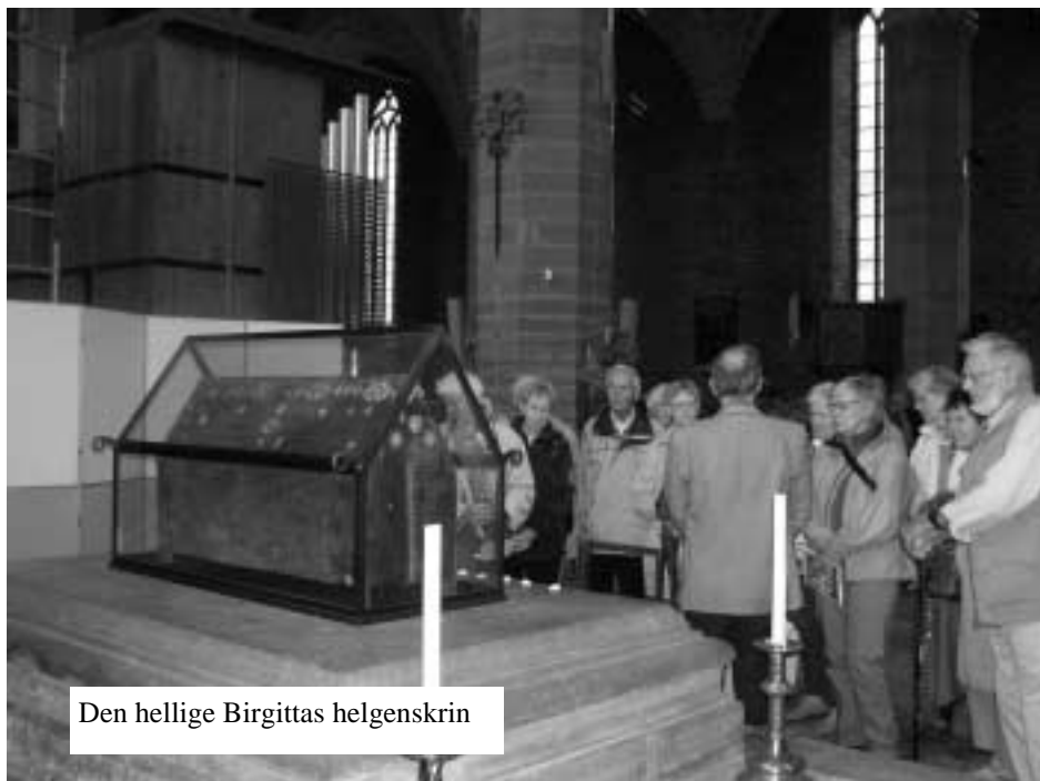
Den hellige Birgittas helgenskrin

Som sagt drog vi med bus mod Sverige via Helsingør/Helsingborg og fortsatte op igennem Halland og det naturskønne Småland. Undervejs gjorde vi nogle korte ophold, dels for at pudre næse og den slags, og dels for at indtage de medbrag-