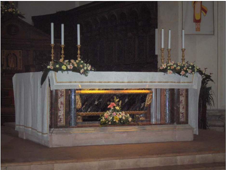
Biskop Rufinus' grav under højalteret i sin kirke

ordre fra den romerske prokonsul. For at omvende ham til hedenskabet sendte prokonsulen to kvinder ind til ham, som havde forstand på trolddom, Nicea og Aquilina. Men da de trådte ind i hans fængsel, blev de slået til jorden af et stærkt lys, og ved Rufinus' belæring blev de omvendt til den sande tro og blev døbt af ham. Derfor blev de to kvinder på prokonsulens ordre torteret og halshugget. Men også soldaterne, der havde været til stede