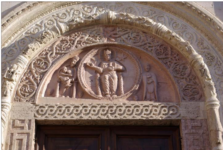
Tympanon i San Rufino. Figuren til højre skal formentligt forstille biskop Rufinus.

Til sidst blev han dømt af kejseren i egen person (hvilken kejser er svært at sige, for hvis årstallet 238 passer, så var der det år ikke mindre end seks kejsere). Kejseren dømte, at han skulle kastes i vandet med en møllesten om halsen, og den 11. august blev han kastet i floden Chiascio ved Bastia og blev martyr "idet han herliggjorde Faderen og Sønnen og Helligånden". Hans legeme blev så bjærget op af vandet og anbragt i en sarkofag. Men af frygt for at hedninger skulle bortføre eller profanere hans døde legeme, blev han efter nogen tid ført inden for Assisis bymure, mens sarkofagen blev efterladt.