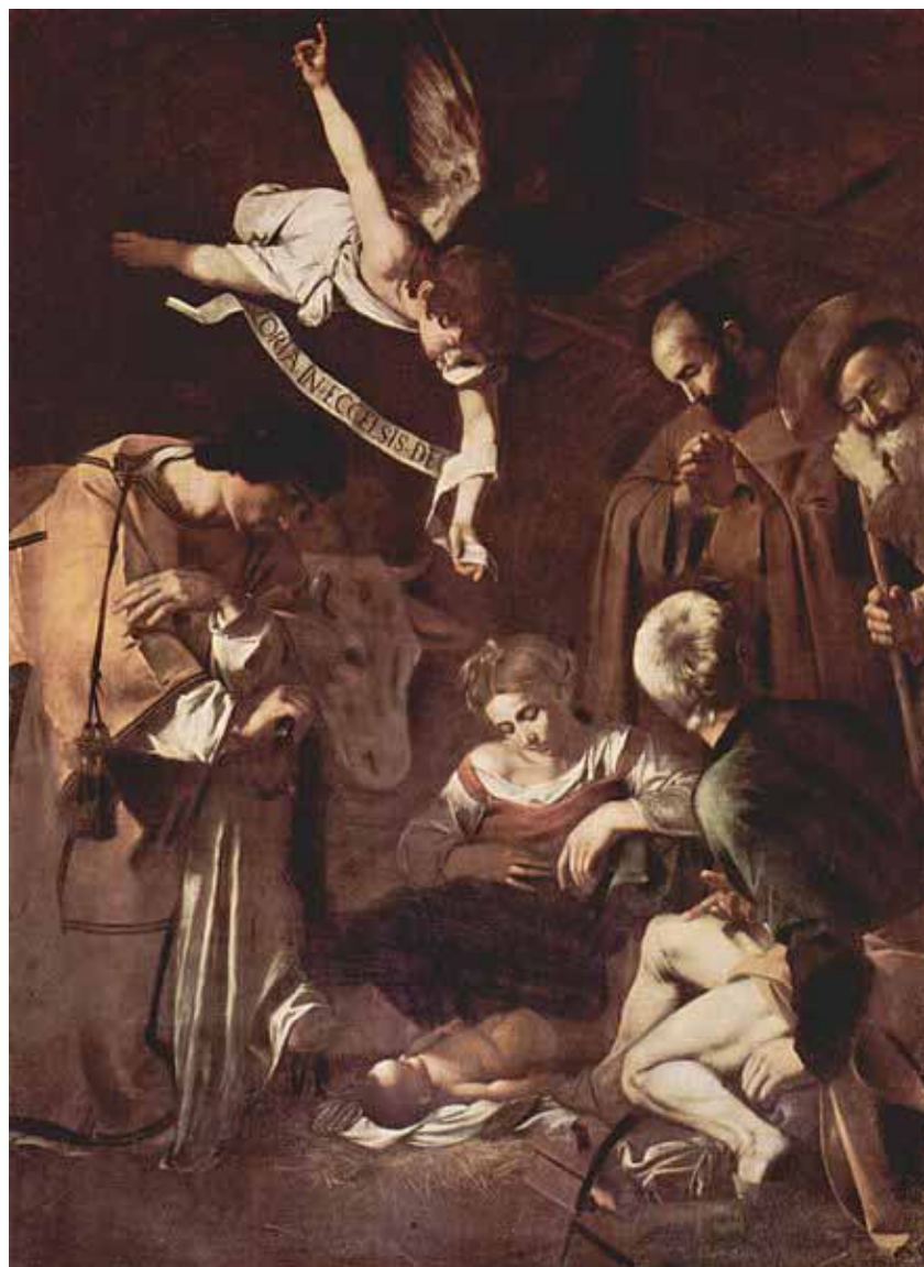
Caravaggio: Jesu fødsel med Sankt Fransiscus og sankt Laurentius