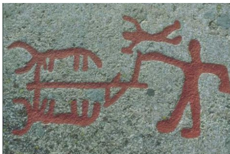
Pløjning med okser - svensk helleristning

og jeg vil tage den okse som min arvelod, og give den til de fattige, eftersom du synes, det er det rigtigste i forhold til Gud.”