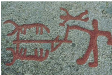
Pløjning med okser - svensk helleristning

og jeg vil tage den okse som min arvelod, og give den til de fattige, eftersom du synes, det er det rigtigste i forhold til Gud.”