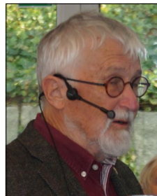
Assisi-kredsens efterårsmøde 23. nov. 2024

(Omridsene i Frans fra Assisis historie kender denne forsamling lige så godt som jeg – og årstallene.