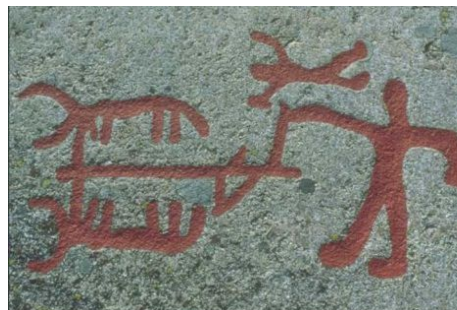
Pløjning med okser - svensk helleristning

Så snart manden hørte det, gik han ud på marken, hvor han havde ladet okserne stå, og spændte dem fra, og én af dem tog han med hen til den salige Frans og sagde til ham: ”Broder, i rigtig mange år har jeg tjent min far og alle i vores hus. Lad os sige, at det her er en lille del af min arv,