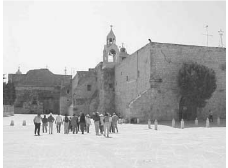
Fødselskirken i Betlehem - under mere fredelige omstændigheder

Fra Ystad kører vi forbi Glimmingehus og spiser middag på en kro på vej mod Malmø inden vi vender hjemad.