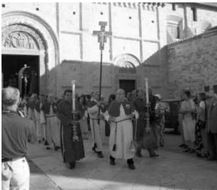
Fra forårets Assisitur: Procession på Kristi Legemsfest