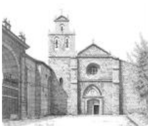
Burgos på pilgrimsvejen

Så jeg spændte min rygsæk på og vandrede et par uger ad den gamle Middelalderrute, overnattede i klostre og herberger. Undervejs mødte jeg andre pilgrimme : en keramikker fra Canada, en bankmand fra Belgien, en scenograf fra USA, en arbejdssøgende fra Spanien, en IT-konsulent fra Brasilien og en læge fra Frankrig. Alle havde vi forskellige motiver til at vandre : religiøse, sportslige, kulturelle... men fælles for os var, at vi var drevet af en længsel – længslen efter frihed, længslen efter enkelthed, længslen efter Gud. Mødet med disse moderne pilgrimme fik mig til at tænke på dem ældgamle formulering fra Davidssalmen (42,2 – 3a) : ”Som hjorten skriger ved det udtørrede flodløb, sådan skriger min sjæl efter dig, Gud. Min sjæl tørster efter Gud, den levende Gud.”