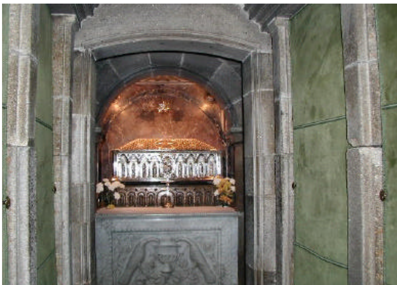
Sct. Jakobs grav i Santiago di Compostela

Da vi alle pilgrimme om aftenen samles til pilgrimsmesse i den gamle kirke, nyder vi kannikernes messesang. Så træder præsten frem i det flakkende lys og tunge røgelsesduft og opfordrer os pilgrimme : ”I begiver jer ud på en vej, tusinder har vandret før jer. Vi beder jer betræde den med åbent sind!” Herefter løfter præsten