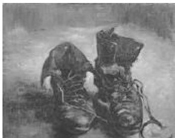
Måske så støvlerne sådan ud - men disse var nu van Goghs!