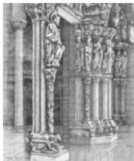
Hovedportalen til Sankt Jakobs Kirke i Santiago.

Jeg går ind i byen, forbi markedspladsen med det brogede folkeliv og videre gennem de smalle, brolagte gader. Endelig træder jeg ind på pladsen, hvor Domkirkens kæmpemæssige tvillingetårne hæver sig mod himlen. Jeg går op ad trappen og ind i kirken, der er Spaniens største helligdom. Her er dunkelt, og luften er tyk af røgelse. Som traditionen foreskriver, styrer jeg mod hovedportalen og lægger hånden på den slidte søjle, som bærer Jacobs statue. Og jeg tænker på de tusinder af pilgrimme før mig, som har lagt deres ønsker, længsler og bønner i Guds hånd på dette sted.