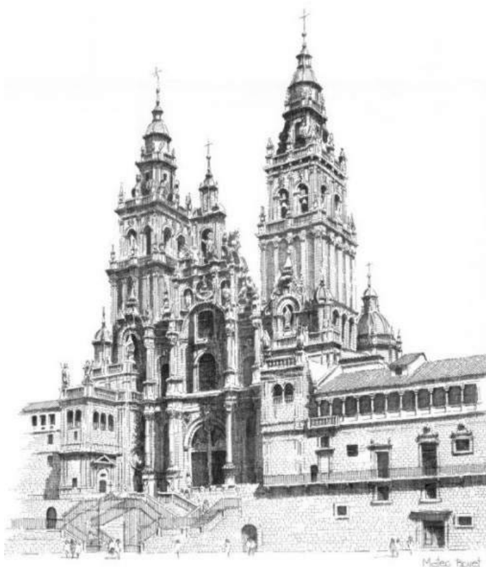
Sankt Jakobskirken i Santiago