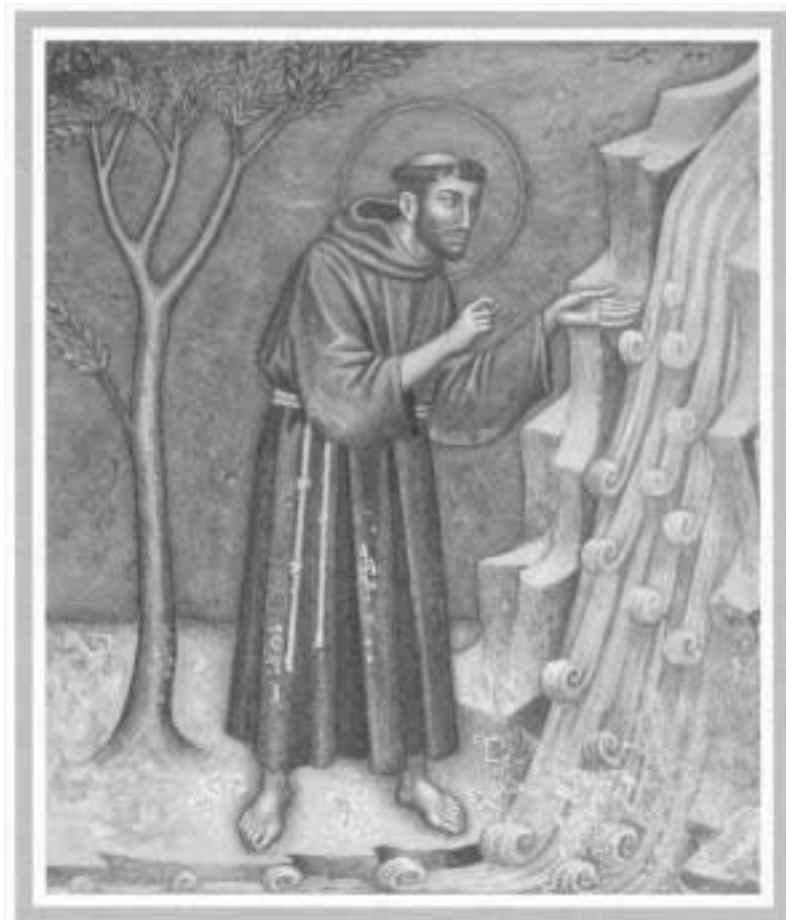
Illustration Piero Casentini